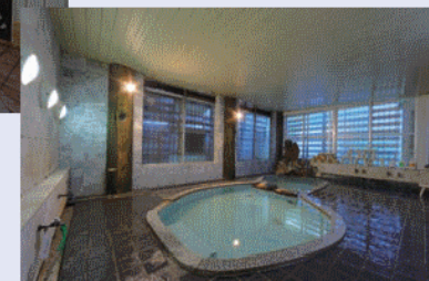
【ぬっくりの金太郎湯】 Bath room