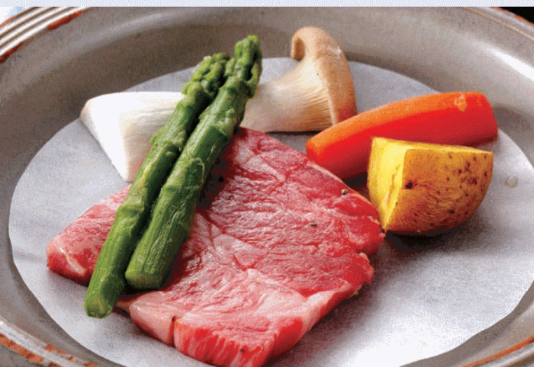
【会食場「萌賞」】 Dining space

山・海の旬な素材を 厳選して盛り込んだ古勢起屋別館の あたたかみのある郷土料理。 真心を込めて… 四季折々の風情を 存分に感じながら、 自慢の料理を どうぞご堪能下さい。