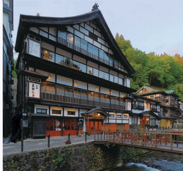
【古勢起屋別館 外観】 Externals of KOSEKIYA BEKKAN