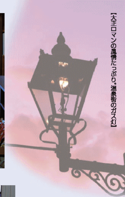
「大正ロマンの風情たっぷり。温泉街のガス灯」