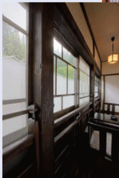
【川側の客室の一例】 Guest Room